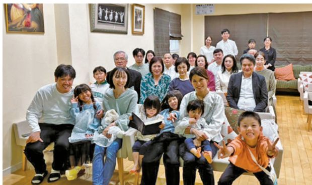
大阪生野教會分設的名古屋聚會點

若不是耶和華建造房屋，建造的人就枉然勞力；若不是耶和華看守城池，看守的人就枉然儆醒（詩一二七1）。