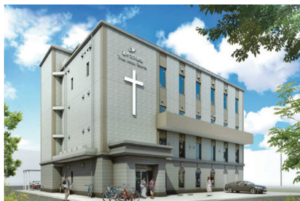
東京墨田教會新會堂設計