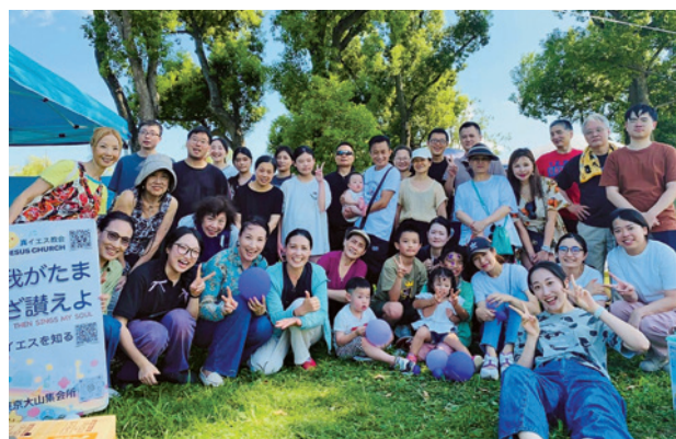
東京教會分設的大山聚會點

總會成立後，各地教會積極規劃分設與建堂。目前橫濱教會分設新子安；東京教會分設大山；千葉教會分設松戶；大阪生野教會分設神戶、名古屋等地。