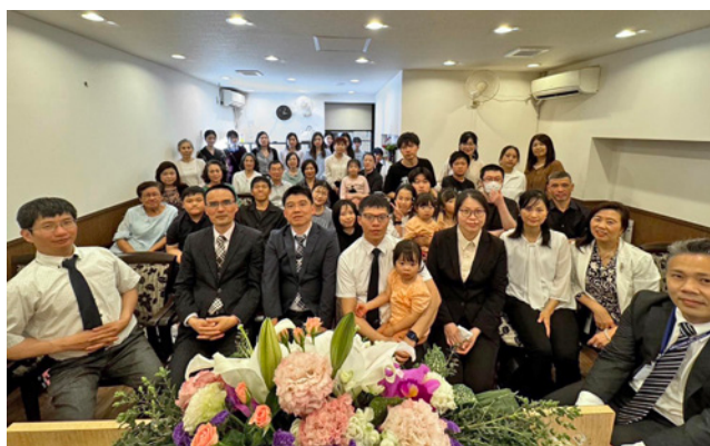
橫濱教會分設的新子安祈禱所

各地教會每年舉辦詩歌交流會，輪流使用大型音樂廳或集會所，將詩班詩歌結合見證與佈道，藉著音樂分享神的恩典，讓詩歌成為傳福音的翅膀，見證生命的信息。