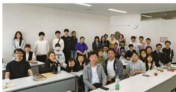
大阪生野教會分設的神戶聚會點