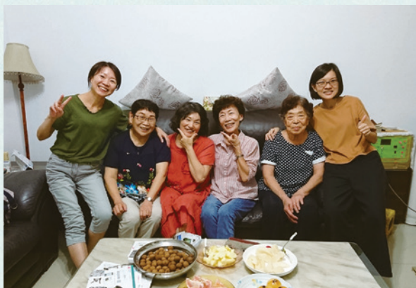
宜君（左三）和北臺中福音組同工

經過了一週之後，我再次得到聖靈，而這次的經歷，和之前完全不同。當下我流淚不止，甚至說不出話來，那感覺就像一個孩