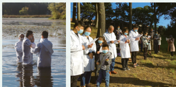
上）表哥一家於波士頓教會宗教教育教室 下）2020年表哥一家受洗