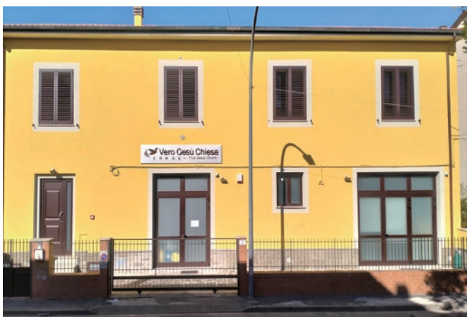
義大利恩波利祈禱所，年底前有望改為教會

在其他地區，我們也看到了一些成長。限制令解除後，有學生和家庭前往歐洲求學、工作和支援聖工，孩童們在當地出生並受洗。假如我們回顧現今在歐陸聯絡中心的會堂，可以發現，過去的十年間，幾乎每兩年就有一間教會獻堂。現在，我們應該增添更多神的兒女，使這些會堂被坐滿。