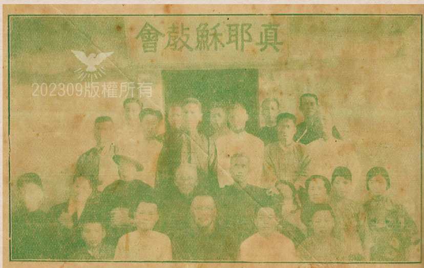
1930年12月 第一次臺灣支部神學會於和美 18