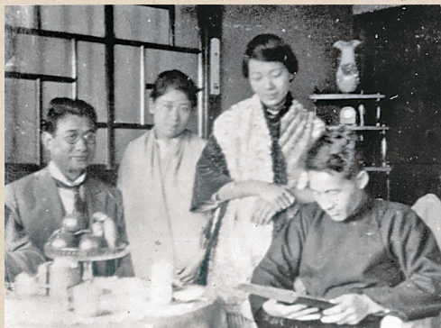
1923年蔣渭水（右）與首倡白話文的先鋒——黃呈聰（左） 在大安醫院裡商議要事，兩位夫人在旁聆聽 9

當時甫成立的「臺灣文化協會」，不避諱官方之監督，「文協」總部即設置於蔣渭水在臺北市的大安醫院自宅 10 ，蔣渭水雖因入獄之故，未能參與新、舊文學之論戰，然而卻以白話文大量創作所謂「獄中文學」，堪稱白話文運動的忠誠實踐者。