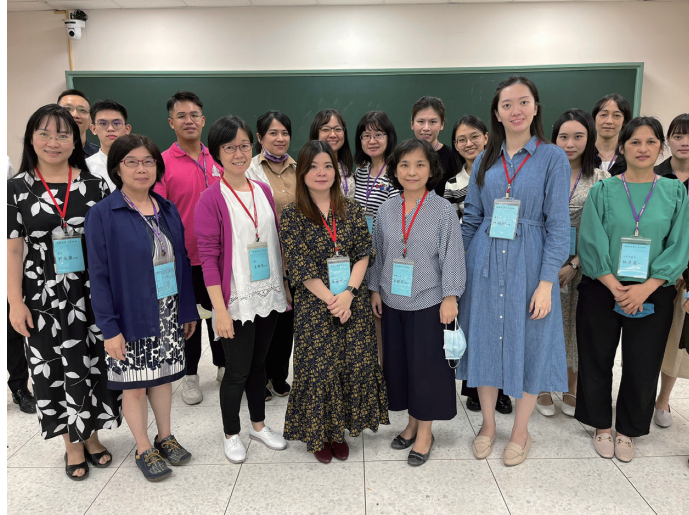
指揮研習營講員與學員照