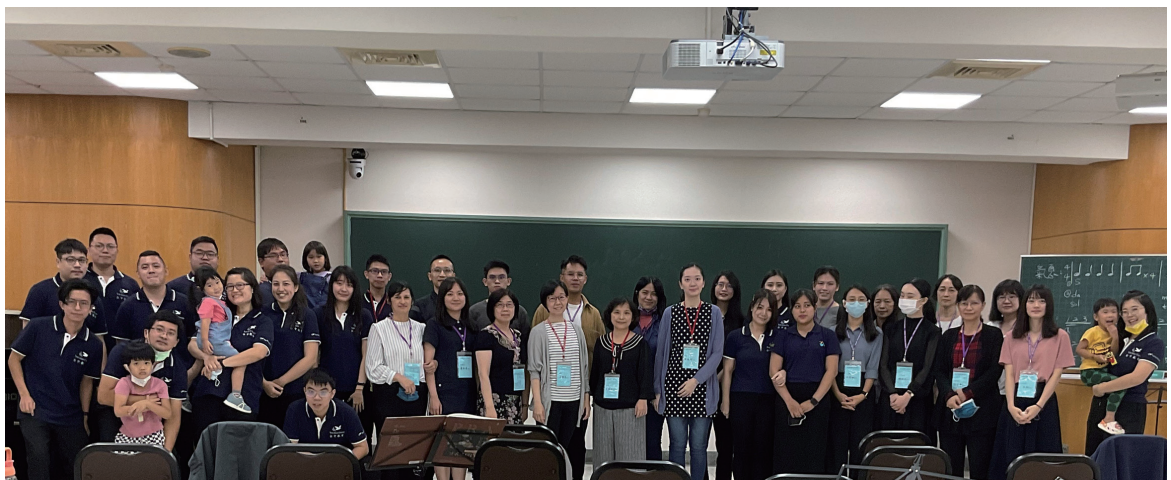
指揮研習營大合照