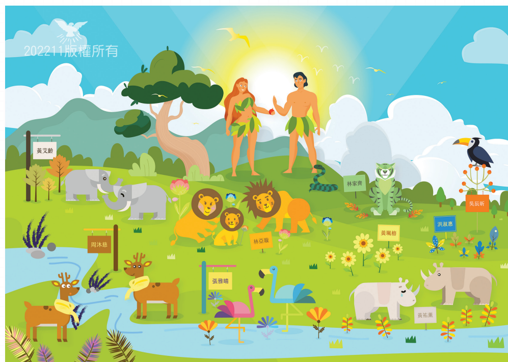
文宣營電繪組共同創作——伊甸園

在這次的文宣營中，學到了如何用向量繪圖的軟體來製圖，雖然並非本科系出身，但其實有修習過美術相關、介面設計、攝影等等的課程，所以還算聽得懂。但實作的時候卻跟想像中的差異很大，發覺需要許多經驗的累積，才能快速地勾勒出想要的線條，