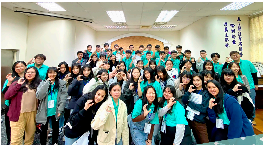
▲2021年12月 西大團契靈修會于仁愛教會

「西大團契」全名為「西區大專團契」，是目前隸屬西區唯一的一個大專團契。臺灣真耶穌教會現有的大專校園團契，大多數是由單一學校或幾所鄰近的大專院校之主內大專生所組成，有固定牧養的教會，是以校園為取向的大專團契。然而，與其他六個教區的大專團契不同的是，西大團契純粹是由西區出身的大專生所組成，直接由教區所牧養，是以教區為取向的大專團契。因此，凡原屬教會隸屬西區的大專生，都是「西大」的當然成員。