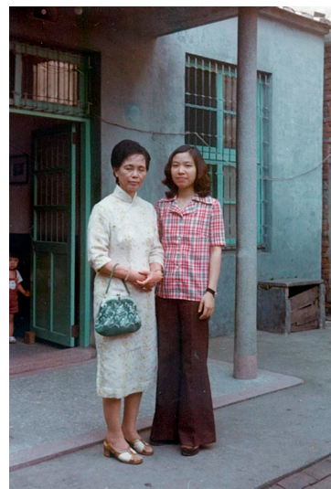
▲梁執事娘與秋英當年合照