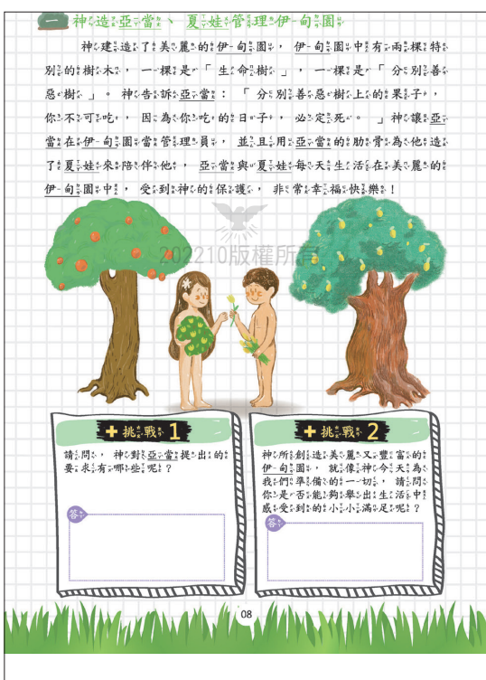
幼年班1-1-2課——學員本內頁

對於小朋友手上拿到的學員課本就會設計得比較活潑，有插圖等輔助來說明課程內容，也有設計許多手寫以及貼貼紙的部分來增加課程的趣味性，提高小朋友的專注力。