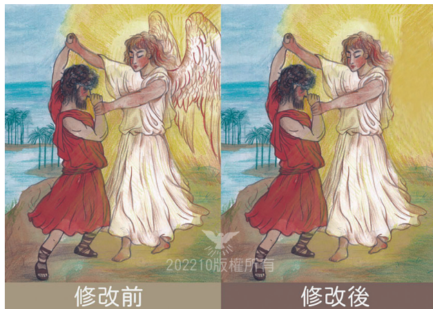
幼年班1-1-9掛圖——雅各與天使摔跤舊版與修改後

幼年班1-1-9的掛圖，內容講到雅各與一名天使摔跤。但聖經並沒有明確表示天使的長相，會這樣畫只是方便老師向小朋友說明「他是在跟天使摔跤」，而不是「天使長這樣」。希望教員上課時，能傳達給小朋友正確的觀念。