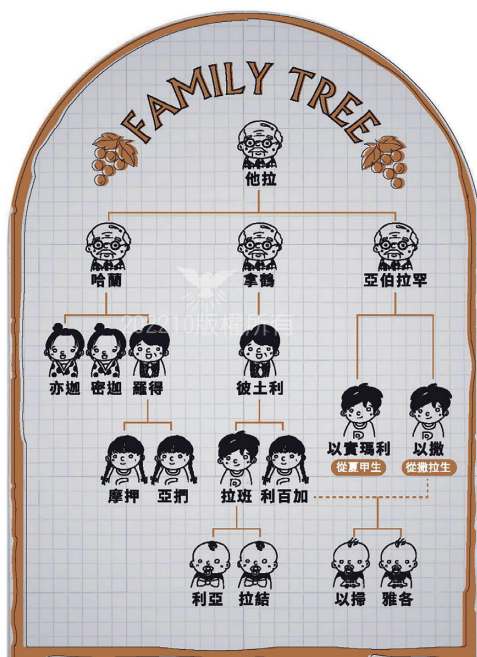
少年班1-1-5課——教師本的亞伯拉罕家譜

在少年班有許多的地理地圖、人物關係圖的表現，能讓小朋友更清楚聖經中的人物關係及地理概念，也方便老師講解！