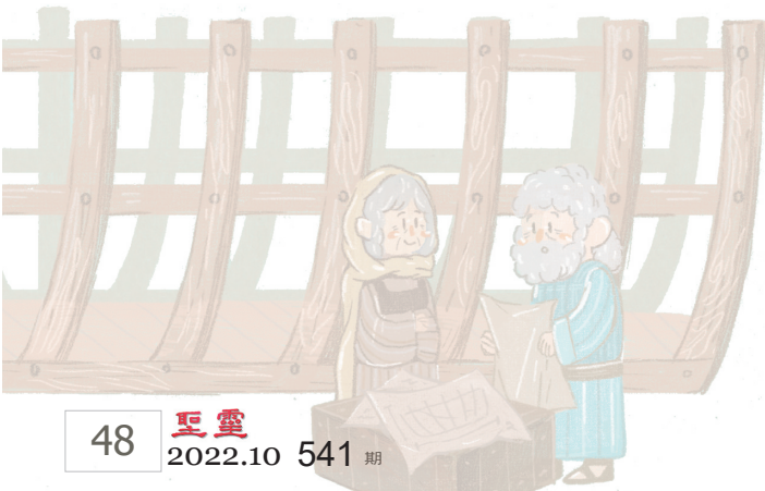
少年班1-1-5課——教室本內頁