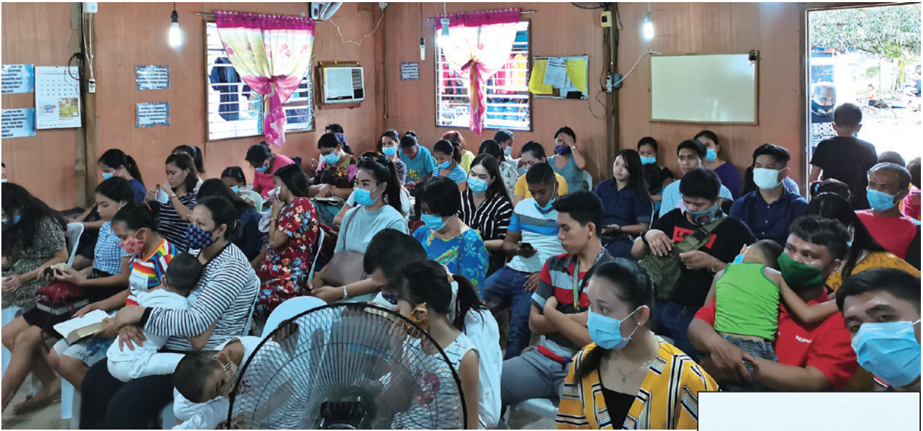
7月16-18日舉辦靈恩佈道會，87人參加，13人受洗。