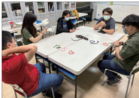
高階班教學老師培訓 高雄班