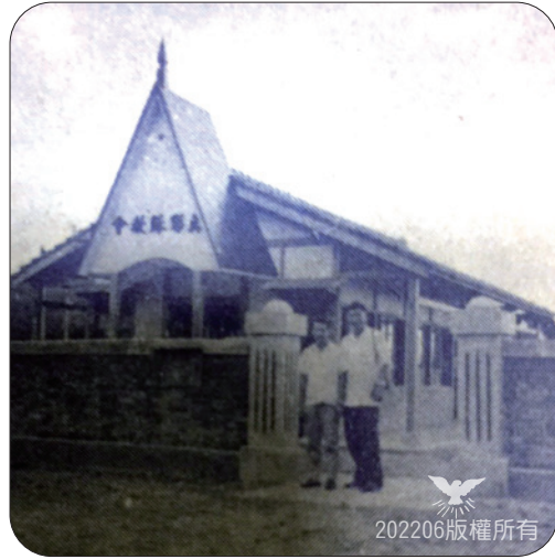
▲蔡廷英（守道執事）、高木根（恩峰傳道）於建堂完成時，於門口留影 4 。

為答謝1946年張家陷入極端困頓絕境時，上主及時伸出援手，擊退撒但魔爪之鴻恩，1960年，張江林、張俊仁父子分別獻地各40坪供建堂用。嘉義母會則全力贊助、協助：蔡守道執事繪製設計圖、監造，內埔本地負責人也密切配合。