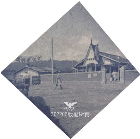
▲ 1960年8月21日一早，獻堂典禮前，特別拍攝會堂全景 5 。