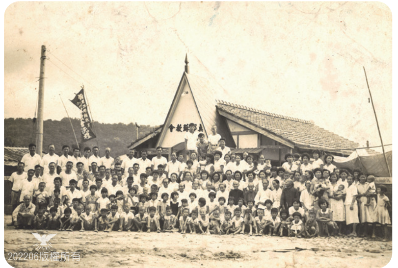
▲ 內埔首度舉辦靈恩佈道大會，圖左會旗飄揚。1960-8-21（日）獻堂典禮合照 6 ，內埔教會正式創設！