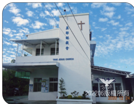
▲ 2020內埔教會新會堂全貌（附設學生中心）