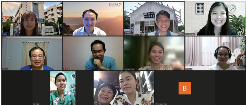
2021年8月 線上崇拜聚會

新冠 肺炎大流行嚴重打擊了全球的生活，並且影響了教會大部分的宣道事工和開拓計畫，但這些不利的情況對越南（胡志明市）的開拓工作來說，卻是一個變相的祝福。每個星期五晚上，我們有4至6名當地的越南朋友與我們在越南的信徒，同時與馬來西亞和新加坡的信徒一起在 Zoom 平臺參加線上安息日聚會。聚會的時間必須調整至晚上8點30分至9點30分（越南時間），以便我們的志工講員能在結束他們本地的教會聚會後，再登入 Zoom 領會。