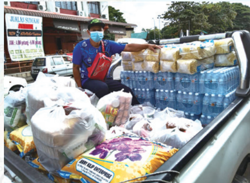
洪災後，緊急靠四輪驅動車子載送援助賑濟物資進入災區。

「遭患難的日子你當思想」（傳七14）。讓我們反省，這是否是對我們的警告？讓我們從舒適圈中做醒與謹守嗎？（帖前五6）。「所以要束縛你們的心，謹慎自守，專心盼望耶穌基督顯現的時候所帶來給你們的恩」（彼前一13）。神要我們靈修，使我們在走出這新冠病毒的危機之後，靈性能夠更加成熟，面對即將降臨的大患難（太二四21-29；啟七14）。