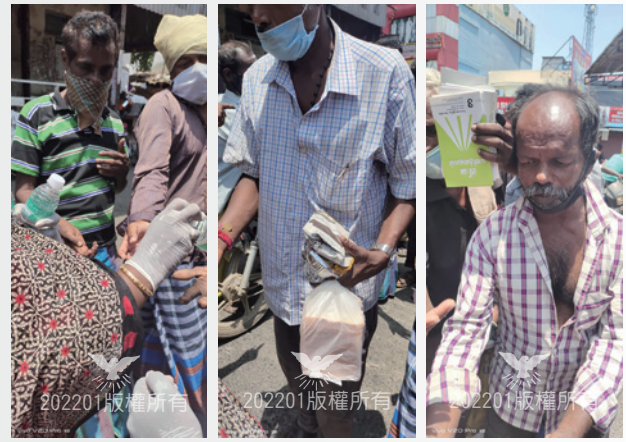
到大街上去分發食物飲料，並同時分發福音小冊子

盧比300,000元）給那些受第二波新冠疫情影響的信徒家庭。印度當地教會也自行籌措了馬幣2,000元（約印度盧比31,000元）。當印度政府開始逐漸放寬限制的時候，他們也到大街上去分發食物和飲料，同時也分發福音小冊。