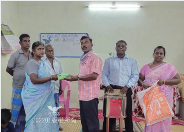
自發性地分發米糧給受疫情影響的信徒家庭