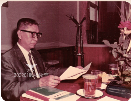
擔任淡江大學董事長時之照