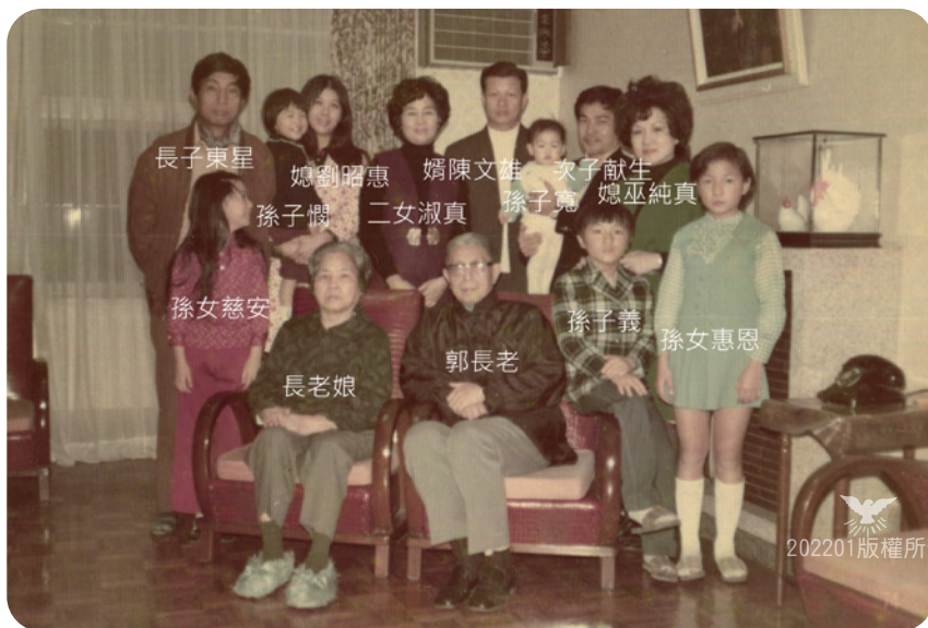
1974年1月於公園住宅照

對長老而言，教育上的投資就是經濟上的投資，而且，知識就是財富，不會被人掠奪，又可以隨身帶走。因此他認為，雖然投資南投客運公司看起來無利可圖，但起碼可以為偏遠地區的人民盡一己之力，使他們有方便的交通工具，能到都市工作就學，如此一來也較有機會擺脫貧困的循環，對未來能抱持希望。秉持著這樣的信念，長老排除眾議，不但入股南投客運，還提供人力及車輛進駐南投，一步步實現他的理想。而他的思維總是如此，處處為弱勢著想，就算賠錢也在所不惜。