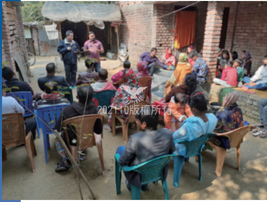
在卡利甘傑的聚會