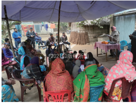
聚集在庫爾納專區巴乾鄉Chaultary村 (Chaultary, Bagan, Khulna)