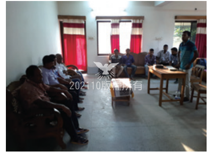
酒店房間裡查經——卡利甘傑