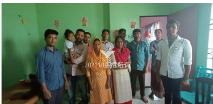
在錫爾赫特市的聚會