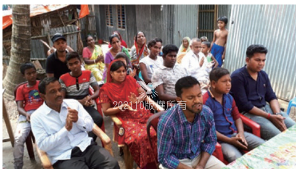
聚集在庫爾納專區巴乾鄉Chaultary村