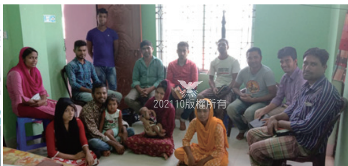
在錫爾赫特市的聚會