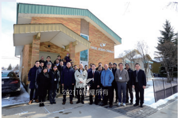
2020年3月加拿大全國教會代表會議於卡加利教會

因為會堂本體老舊及結構上的問題，使得工程進度一再延宕，但教會全體弟兄姐妹不斷地代禱，終於有所突破與進展，請大家繼續關心代禱，教會也積極培訓聖工人才。感謝主，在2021年7月7日首次在教會的餐廳（Dinning Hall）作臨時聚會之所。由於主會堂的工程仍然進中，請大家繼續代禱和奉獻。