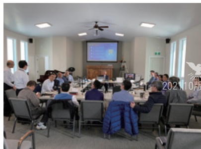
疫情前仍可一同出席全國教會代表會議