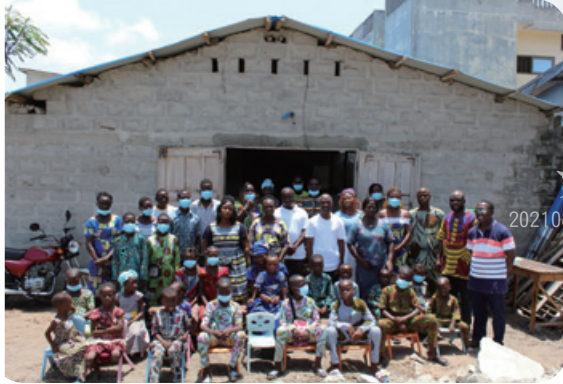
貝南教會重返合照