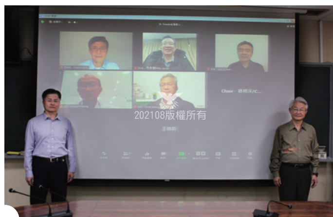
▲第13屆新任聯總常務負責人 2021年3月23日於臺總與Zoom視訊會議