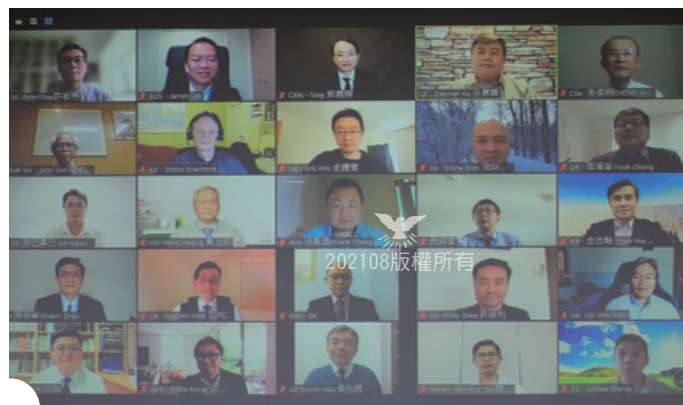
▲13-1聯總世界代表大會各國代表 2021年3月22-23日