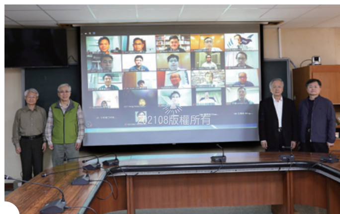
▲第12屆第4次聯總真理研究委員會 2021年3月15-16日於臺總與Zoom視訊會議