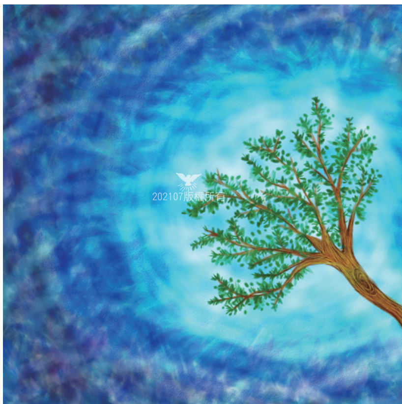
▲就在摩西的呼求與神的指令之下，以一棵樹丟入水裡，水就變甜了。再大的艱難，如黑雲滿布，神一出手，瞬間撥雲見日，生活的難題嘎然終止。

再說，沒有經過瑪拉的缺水之苦，豈感受得到以琳泉之美？原來耶和華神早為他們預備了十二股水泉與七十棵棕樹的休憩之地，只要他們忍過瑪拉之苦，就可通過信心的考驗，有甘泉可享用。可惜！這次的考驗，以色列民顯然不及格了。「十二」與「七十」或許是一種表徵式的數字，否則幾股泉水與些許棕樹，豈足供百萬雄師的飲