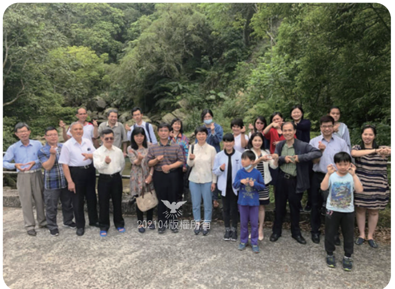
春季靈恩佈道會於三峽竹坑溪受洗紀念 2018. 4. 28