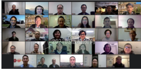
全國教會會議透過ZOOM舉行