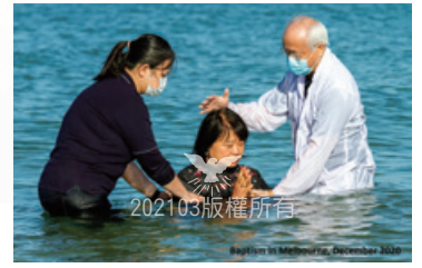
2020年12月墨爾本教會洗禮

去年，是困難的一年，但感謝神的恩典，在祂的保護和帶領之下，許多教會還是能繼續推動聖工。