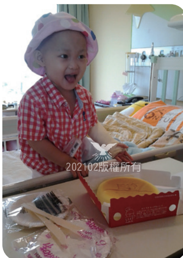
喜樂的心乃是良藥

當時我一邊處理語忻轉病房事宜，一邊照顧剛出生的二女兒，甚至要一邊照顧剛生產而住院的太太……。但是感謝主，因著家人的幫忙，終於有驚無險地度過了那段辛苦的過程。