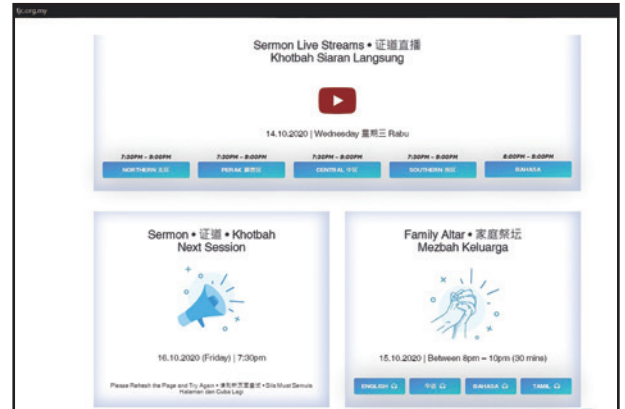
線上講道集與家庭祭壇單元