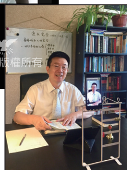
網路安息日聚會分享者

自4月15日開始，部分信徒也持續參加歐陸教會每週三、五下午的線上基本信仰學習。藉著疫情，教會也鼓勵同靈好好利用難得的閒置時間多禱告、多在網路上觀看本會各地教會的聚會視頻和資訊，並在莫斯科教會的微信群和QQ群裡彼此分享。感謝神！有的同靈克服時差的不便，全程觀看美國教會線上靈恩會的直播，有的信徒持續參加中國福建教會每晚的線上聚會。