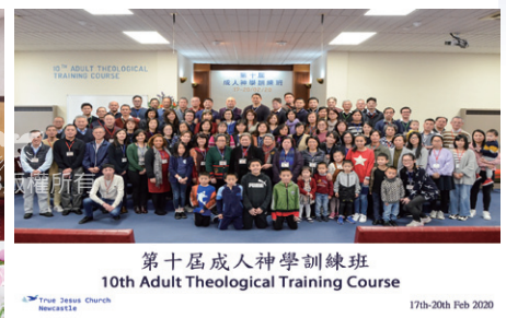
第十屆成人神學訓練班 10th Adult Theological Training Course