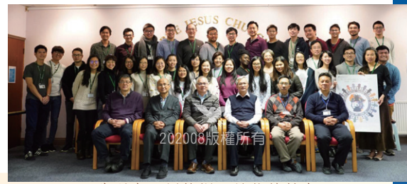
非洲事工訓練課程於倫敦教會

2020年是第十二屆英總負責人會的開始，新一屆有著不同的組織架構，亦有人事變動。英總負責人的人數減至15名，包括12名教會代表及3名英總傳道。負責人會在2月初同意以「分辨時候、做醒豫備」為英國教會2020-2022年度的主題。