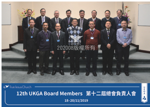
12th UKGA Board Members 第十二屆總會負責人會 18-20/11/2019