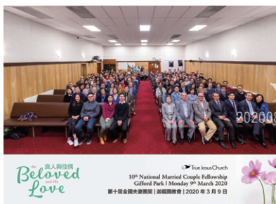
Beloved Love 10th National Married Couple Fellowship Clifford Park 1 Monday 9th March 2020 第十屆全國夫妻團契 | 聖福蘭教會 | 2020年3月9日