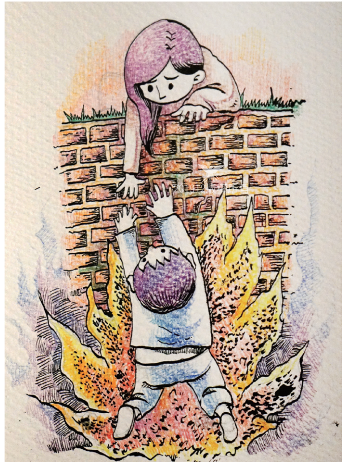
▲以敬畏的心盡他所能之事，期望能夠拯救被迷惑的信徒脫離撒但的網羅。