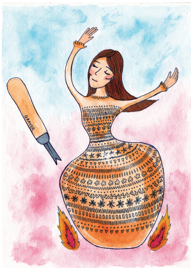
▲順服神忍心的火燒和細描花紋，燒成神喜悅的小器皿。

婚姻乃神所配合，婚姻不是父母或青年挑選的結果，神常常以婚姻為過程火煉祂的兒女，以婚姻來建立祂與兒女的個別關係，這和信徒誤以為婚姻只是享受兩人幸福的甜美之路，恐怕是天差地遠的認知！婚姻就是兩個罪人的成聖之苦路……。