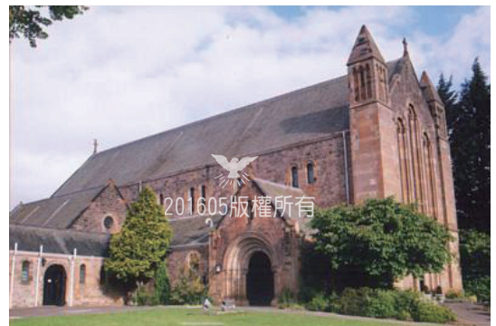
▲Edinburgh Church building 愛丁堡教會外觀