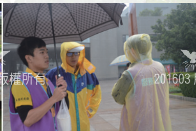
逢甲團契工作人員