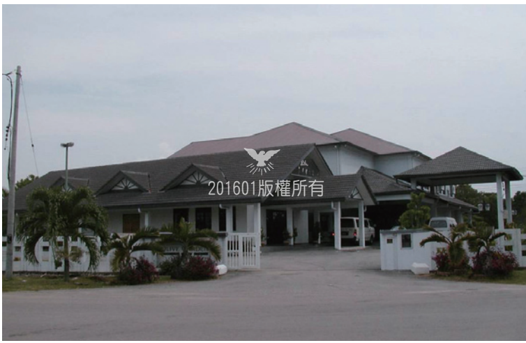
▲馬來西亞波德申教會橄欖園訓練中心