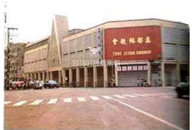
▲台灣舊總會（現為台中教會）