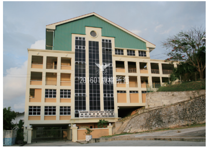
▲沙巴亞庇教會綜合大樓

遍滿全地，正等待我們去收割，並求莊稼的主，打發工人出去，收祂的莊稼（太九37-38）。