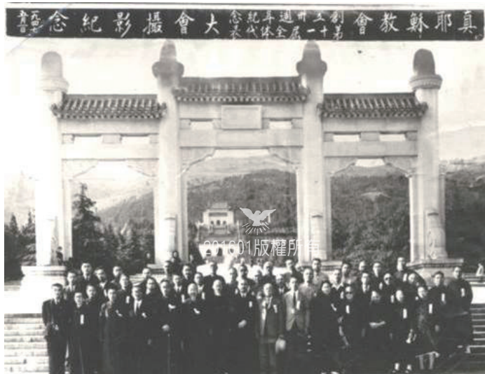
▲1946各國教會代表大會

聯總世界代表大會，由各總會聯絡處、各直屬教區之代表、聯總專職傳道及聯總負責人所組成。聯總置負責人15人，由世界代表大會選舉之，另加上未獲選之各國總會負責若干人，聯總全體負責人互選一人為總負責，並設東宣部、西宣部、文宣部、訓練部、財務部與總務部。策劃年度聖工，並執行聯總相關聖工，每屆任期四年，至第六屆期則每兩年召開一次會議，並配合會議召開真理研究委員會、青年事奉委員會及聖工研討會，其組織架構圖如下表：