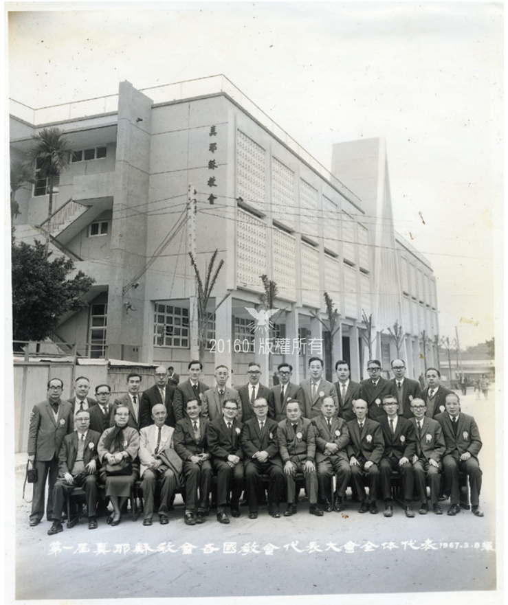
▲第一屆各國教會代表大會