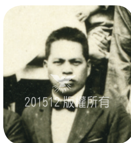
1927年須田於臺南歸信時留影（34歲），成為花蓮地區後來真道遍傳的第一粒種籽。