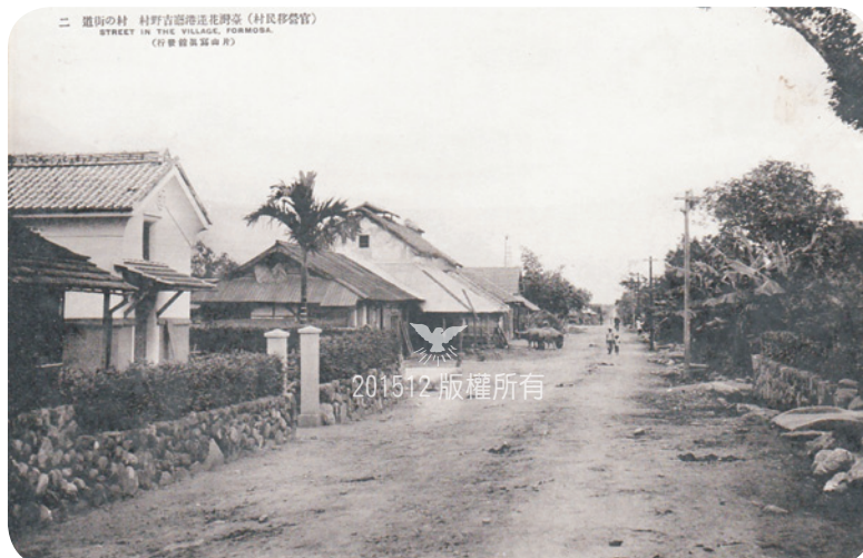
圖為日本移民區「吉野村」宮前聚落五間路的街景（今吉安鄉中山路），此乃須田居住生活環境，距花蓮市區僅約1公里 12 ；此外，「吉野村」村民常一早即將所收割農產品用牛車載赴花蓮街市場販售，咸信青年時期的須田與家屬應也對花蓮港街極為熟稔，並且對花蓮風土民情蘊育出深厚的感情。