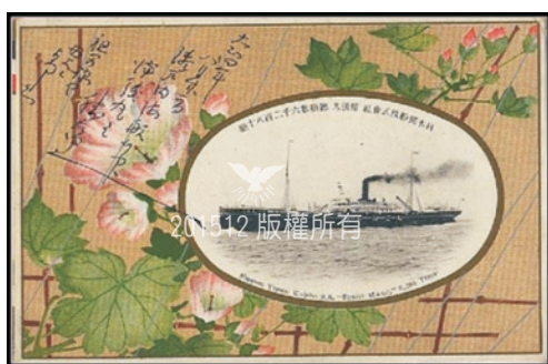
1911年須田一家由日本搭「備後丸」號 11 （上圖），抵基隆港，再轉搭「宮島丸」登陸花蓮。

為響應日本政府移民臺灣殖民地的號召，須田氏舉家於1911年搭「備後丸」號由日本啟程，於11月8日抵達基隆港；再由基隆轉搭「宮島丸」號經蘇澳，於中旬抵達花蓮港街，因當年尚未築港，無法靠岸，大型輪船僅能先在南濱外海100-200公尺遠駐泊，等候岸上划舢舨小船停靠輪船下，全家大小背著行李攀爬下舢舨小船，再用繩纜將舢舨小船拉上岸， 9 定居「吉野移民村」（今花蓮縣吉安鄉南華教會附近），時為蔡聖民執事來花蓮開拓前24年。