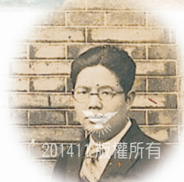
施浸者：高路加執事 44

上圖左：臺南新運河打自1926年竣工通航後，第二年（1927）須田與上田係第一、二位在此受浸的日本籍傳道人。圖為日治時代「台南新運河」一瞥 45 ，停泊著許多來自大陸戎克船。（施惠雅美工）