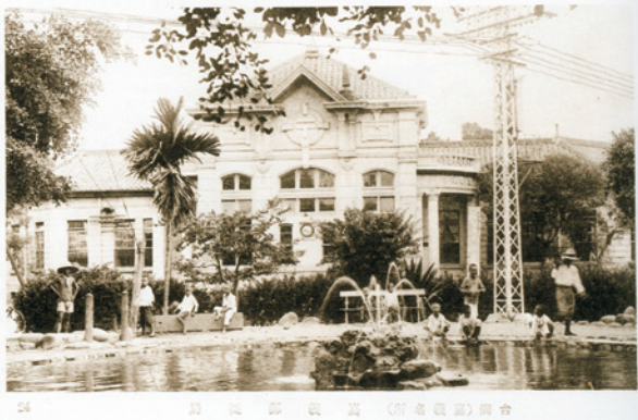
日治時代嘉義中央噴水池與近鄰的郵政局

再加上聞名全臺的「嘉義八景」（「玉山雲淨」、「林場風清」、阿里山……），嘉義在臺灣的地理交通地位益加燦爛輝煌，充滿著無限的光明前景。吾人審視造物主行事風格知悉：造物者行事有其計畫與步驟，例如造人工程係先全方位佈局，直等到萬物均造成，壓軸的亞當夏娃才出現於伊甸園；同理，神國在嘉義的橋頭堡之營建，也就在上述種種佈局後，才悄然孕育，勤奮耕耘、施肥、除草，耐心呵護，直到開花結果……。