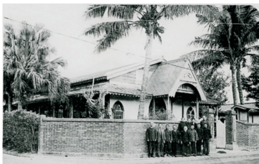
嘉義東門長老教會——在真耶穌教會於桃子城創設前58年即已具相當規模（筆者翻攝）

長老教會於1873年（明治7年）即已在嘉義成立 14 ，臺灣光復以前曾分設西螺、牛挑灣、土庫、民雄、大林、水上等長老教會。1926年吳道源（約翰長老）陪同張巴拿巴長老返回家鄉牛挑灣向親屬傳更新福音，所建立的「牛挑灣真耶穌教會」，乃是由此長老會所分設；再5年後，真耶穌教會於嘉義山仔頂成立。