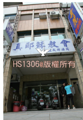
北成祈禱所

第一天的行程，上午訪問位於羅東的北成祈禱所，依據總務負責人的介紹，因教會空間有限，兒教組的小朋友被安排在附近的教會上宗教教育，成人安息日聚會人數約在80-90名，主會堂在二樓，因座位不足，有的在三樓副堂，甚至有人坐在樓梯的階梯上，可見信徒對道理的渴