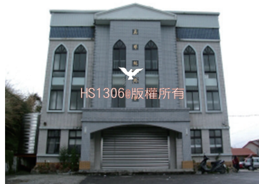
上巴陵教會

第二天的訪問行程，我們來到巴陵部落，很訝異的發現，當地的婦女很多都是計程車司機，男人則大多務農，像是種植水蜜桃或打零工割草等，以從事山上的工作為主。巴陵部落是座落在高山偏遠的山區，那裡沒有市場，也沒有電影院，更沒有24小時的超商或超市，連加油站都沒有，在這物資缺乏的地方，神給他們最大的恩惠是平地所沒有的，好山、好水、好空氣，晚上不用冷氣就可以一覺到天亮。縱然很多地方不像平地那麼方便，但他們卻能自己種菜，享受大自然的贈予，而肉類及生活必需品則每星期