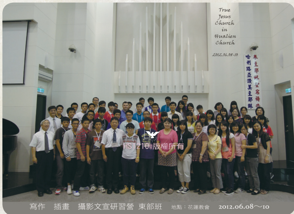
寫作 插畫 攝影文宣研習營 東部班 地點：花蓮教會 2012.06.08~10