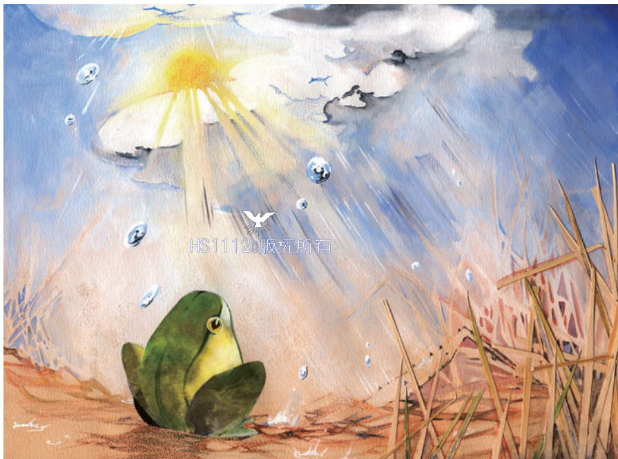
讓信仰、生命有重量、有深度， 會朽壞的形體，將轉變為不朽的永恆。