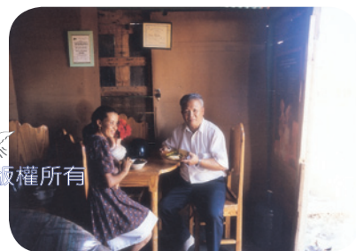
於中美洲多明尼加信徒住所接受款待，黑豆飯。

初抵阿根廷時，信徒熱心地聚集在弟兄姊妹們的家中查經、守安息日。幾位熱誠的媽媽在張羅安息日的愛餐後，更主動幫孩子們上宗教教育課程。環境雖然艱困克難，拿著外頭被丟棄的木箱當課桌課椅，但個個都甘之如飴。終於，在神多方的帶領下，1989年於阿根廷的首都——布宜諾斯艾利斯市成立了真耶穌教會。1999年於中美洲多明尼加的聖彼得市，成立了第二間教會，2001年巴西聖保羅市，2002年巴拉圭與巴西邊界的福斯市，皆成立第三、四間真教會。過程困難重重，身心歷經千辛萬苦，但神的真道終在異地被傳揚和建立。