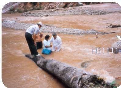
在滾滾黃水中為信徒施洗，於玻利維亞。