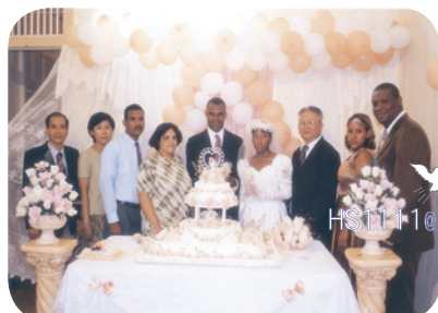
受邀主持多明尼加Floro弟兄的婚禮

初抵阿根廷時，信徒熱心地聚集在弟兄姊妹們的家中查經、守安息日。幾位熱誠的媽媽在張羅安息日的愛餐後，更主動幫孩子們上宗教教育課程。環境雖然艱困克難，拿著外頭被丟棄的木箱當課桌課椅，但個個都甘之如飴。終於，在神多方的帶領下，1989年於阿根廷的首都——布宜諾斯艾利斯市成立了真耶穌教會。1999年於中美洲多明尼加的聖彼得市，成立了第二間教會，2001年巴西聖保羅市，2002年巴拉圭與巴西邊界的福斯市，皆成立第三、四間真教會。過程困難重重，身心歷經千辛萬苦，但神的真道終在異地被傳揚和建立。