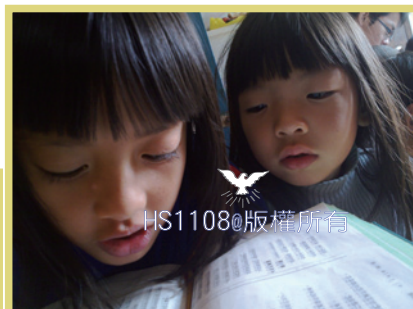
有趣好玩的共習課