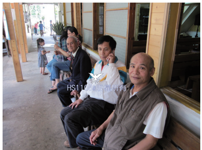
里佳教會弟兄姊妹們