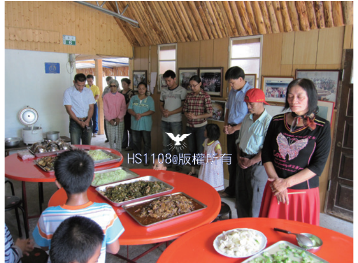
享用神賞賜豐富佳餚

也求神幫助，讓我們每位願意奉獻精神、體力的老師、弟兄姊妹，身體健康、往返路程平安。求神恩待山上居民，減少災難發生。