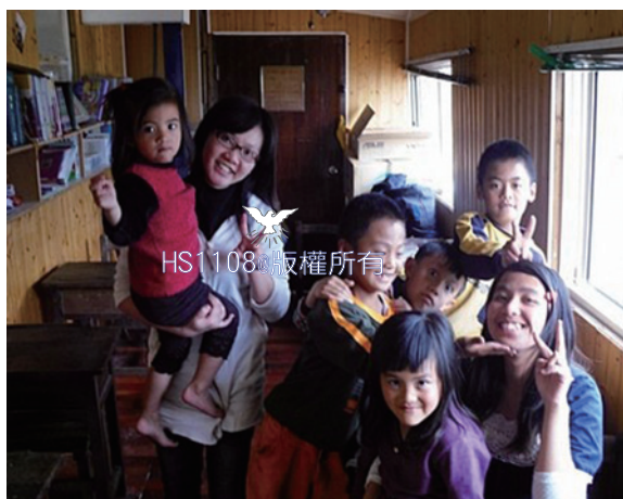
雋宜、主庭姊妹與小朋友合照

安息日當天，早上七、八點的時候，信徒便會陸續來到教會，從教會的門口看對面的山，是一個原始森林，所以里佳也被稱為藍色部落。阿里山的達邦到里佳途中，在二-五月的晚上有許多的螢火蟲，也有非常清新的空氣，如果有機會的話，大家可以來這邊享受；偶爾離開匆忙煩悶的環境是不錯的選擇。