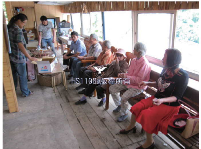
里佳教會弟兄姊妹們