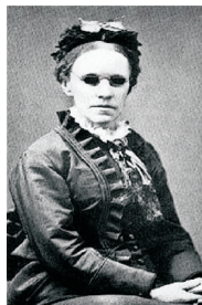
Fanny J. Crosby, 1823-1915