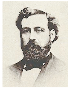
Philip P. Bliss, 1838-1876

施彼福 (Horatio Gates Spafford, 1828-1888) 出生於紐約，居住在芝加哥，他是長老會的信徒，平時熱心參與福音事工，和佈道家慕迪是至交。