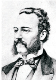
Ira D. Sankey, 1840-1908

Oh Come, with Thy Broken Heart) 都是二人合作的作品。