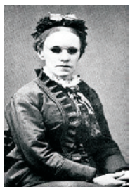
Fanny J. Crosby, 1823-1915

1. 與耶穌同死、同死才得生，與耶穌同活、同活恩日增； God will take care of you, be not afraid, He is your safeguard thro' sunshine and shade;