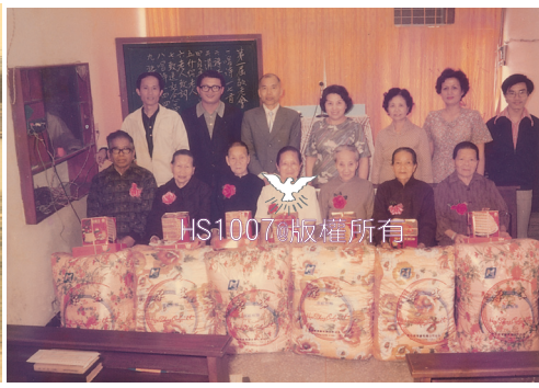
婆婆參加第一次敬老會。

然而這豈不是更證明，神要那凡信祂的人都能明白：基督徒不只是今生今世相聚，更應將盼望放在永生。信主的人既然得著永生再相聚的機會，難道還要在意今生短暫的離別？前人未見即信，正是給那能見到的後人做了信神的好榜樣。