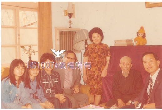
香港教會朱執事一家來訪。