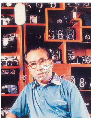
陳梅麗先生擅長拍照。

此生我和先生共經歷了兩次傳染病，均蒙神保守看顧。除此之外，我們皆在禱告中安然度過，沒有任何感染的就醫記錄。