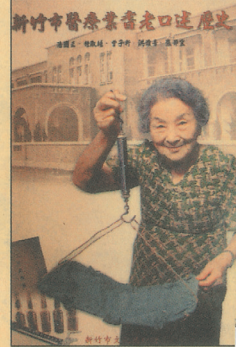
「新竹市醫療耆老口述歷史」收錄19位醫界耆老的生命故事，這些資深醫師、助產士及護士見證了新竹市的醫療史。