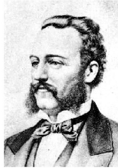
Ira David Sankey, 1840-1908