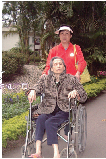
20090319 推婆婆到士林官邸賞花

覺得很丟臉，想結束生命，希望一睡著就不要再起來。她個性溫和，問我有沒有幫手，覺得被我照顧很過意不去，還常對我說為什麼對她這麼好，我告訴她，以前她照顧兒女，現在老了，兒女們當然要照顧她。