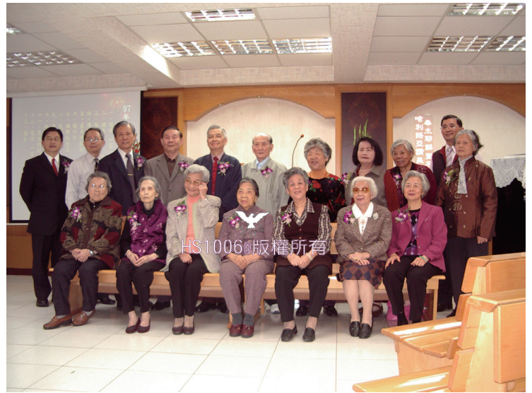
20090228 南勢角敬老會拍的老人全體合照

「居家喘息」部分，我們可以要求每週固定時間來幫忙洗澡或關節活動或協助進食，或陪同就醫等。一般戶補助額度60%，每小時政府補助75元，民眾自付50元。而「機構喘息」部分，可將病人送到政府的合約機構中，接受24小時全天候的日常生活照顧。一般戶，補助額度90%，一天只要付1000元的10%，也就是只要付100元就可以，一年有21天的喘息服務。另外我們也申請了