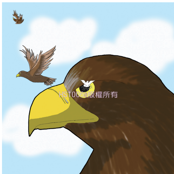
▲「又如鷹攪動巢窩，在雛鷹以上兩翅搨展，接取雛鷹，背在兩翼之上。」（申三二11）

這樣的煎熬，能算是神的愛嗎？不錯，因為鷹雖攪動巢窩，至終還是把小鷹背在兩翼之上。正如保羅所說：「誰能使我們與基督的愛隔絕呢？難道是患難嗎？是困苦嗎？是逼迫嗎？是飢餓嗎？是赤身露體嗎？是危險嗎？是刀劍嗎？」（羅八35）。雖然信徒已經進入愛子的國度，但是面對各種困苦的煎熬：學業、就業、財務、親子、健康……，心中很難不去質疑：神的愛在哪裡？看透萬事的使徒保羅，卻肯定的告訴我