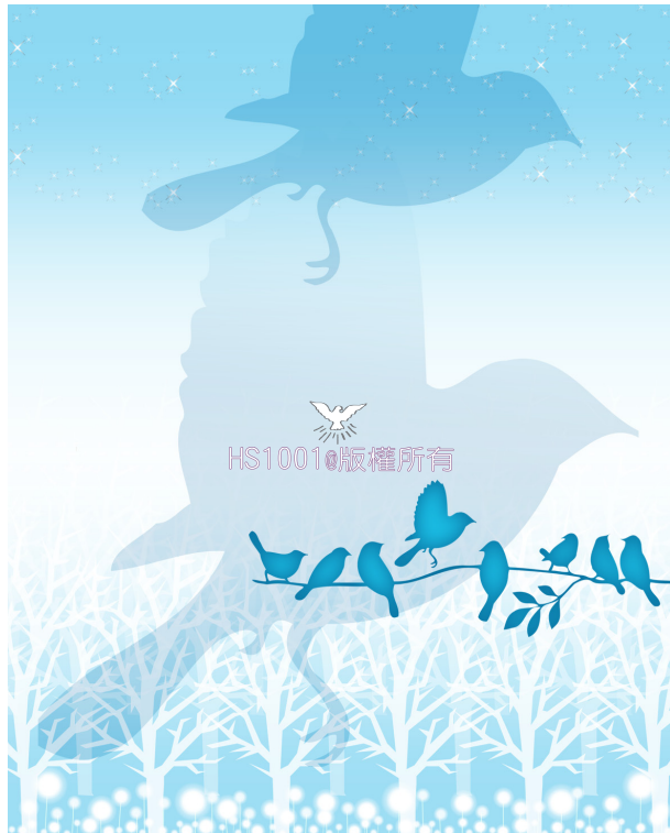
▲安逸的生活易讓人自以為是，不懂得居安思危。

不要因為今生的挫折而懷疑永生的美好，求主讓我們學會忍受至暫至輕的苦楚，仍然信靠祂。只要打開心門，讓主同住，主必會為我們開路，我們必能體會有主同在真好，主能滿足我們一切的需要（太十七1-10；林後十二1-5）。